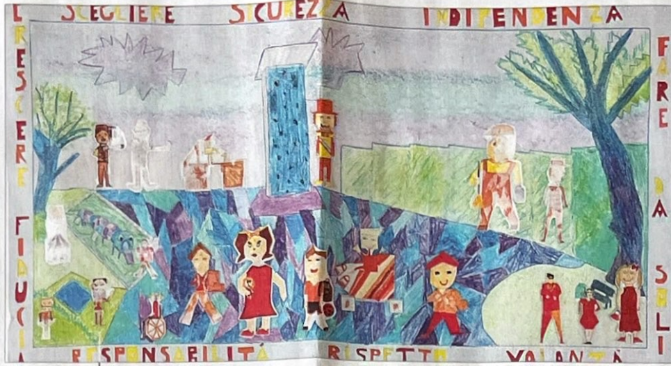
Alcuni dei lavori degli studenti delle scuole primarie che quest'anno si sono ispirati a Fortunato Depero, l'artista roveretano del futurismo, per il 70° anniversario dell'inaugurazione della storica Sala Depero, ex Sala del Consiglio regionale e provinciale, realizzata dall'artista tra il 1953 e il 1956 e che ancora oggi è uno dei gioielli più importanti del patrimonio pubblico