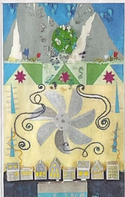
I cartelloni realizzati dai ragazzi durante questo Focus 2026 faranno parte di una mostra legata ai 70 anni di Sala Depero, che saranno celebrati in dicembre. I lavori saranno presentati oggi e poi martedì 12 maggio presso la Sala in Cooperazione. L'iniziativa è realizzata infatti con il patrocinio della Cooperazione Trentina