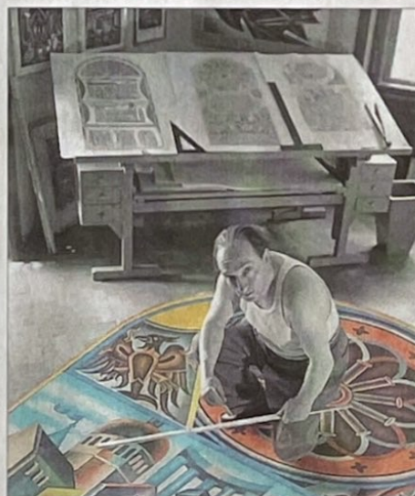
Fortunato Depero mentre lavora alla Sala

Il valore dell'iniziativa, però, sta soprattutto nel metodo: non un esercizio teorico, ma un percorso che porta i ragazzi a capire come nasce una proposta, come si costruisce un ragionamento e come quella proposta diventa realtà. "Ci pensiamo noi" diventa così un modo concreto per avvicinare i giovani alle istituzioni e all'Autonomia del Trentino, con un messaggio diretto: la cittadinanza non si osserva da lontano, si esercita. Appuntamento alle ore 9,00.