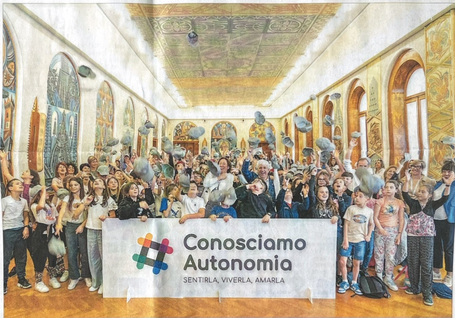
Sala Depero «invasa» dai ragazzi delle scuole con i vertici del Consiglio provinciale: un'immagine che racconta di come le nuove generazioni stiano entrando in contatto con le istituzioni

«Il nostro obiettivo - spiega Claudio Soini, presidente del Consiglio provinciale - è chiaro: rendere questo percorso sempre più diffuso, accessibile e radicato nella vita delle scuole. Perché l'Autonomia, più che una definizione istituzionale, deve essere soprattutto un'esperienza che si costruisce nelle coscienze delle nuove generazioni».