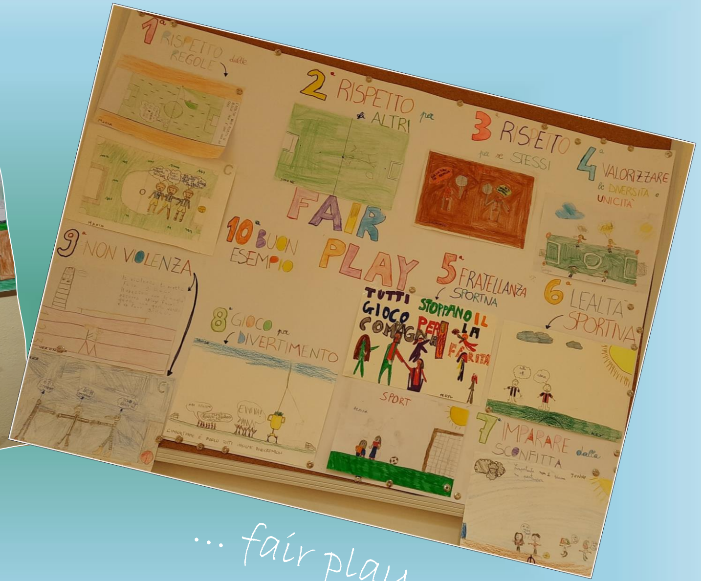
... fair play